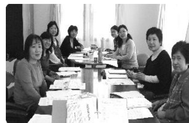
佐久教室のみなさん