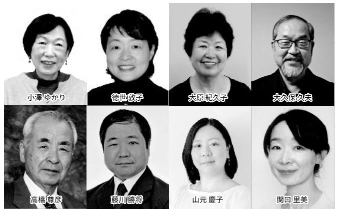
認定心理カウンセラー